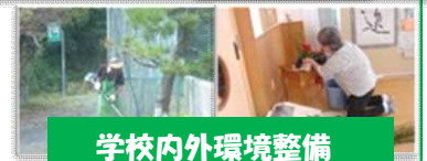
学校内外環境整備

今年度から大和小学校では「地域学校協働本部」を設置し、多くの教育活動に地域ボランティアの方に温かいご支援をいただいています。この協働活動は一方的な学校支援だけではなく、子どもたちが地域に積極的に貢献する互恵的な関係を目的としています。そこで、子どもたちの地域行事への積極的な参加につながればと考え、大和地区限定「地域とつながるスタンプカード」を作成しました。子どもたちへの声かけ等のご協力をよろしくお願いいたします。