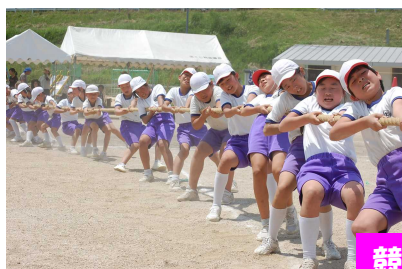
競争・競技も全力！