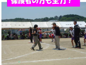
保護者の方も全力！