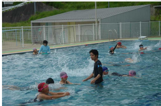
みんなと やってみよう！

5月14日にみんなで分担して、プール掃除をしました。そのおかげで1年間の汚れも落ち、プールはピカピカになりました。