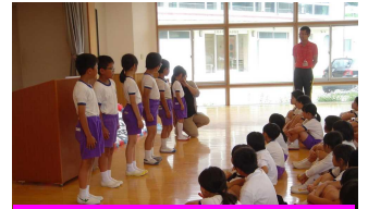
私の今年の挑戦は…

水泳学習は、1に安全、2に学習です。水は生きていくうえで、とても大切なものでもあります。時に私たちの生活や命を脅かすものにもなります。プール開きではプールの使い方や約束を守る話、まずは水となかよくなる話をしました。「長く泳ぎたい」「タイムを縮めたい」など、学年の目標、一人一人の目標に向かって、『自分からそして みんなと』楽しく水泳学習に励んでほしいと思います。