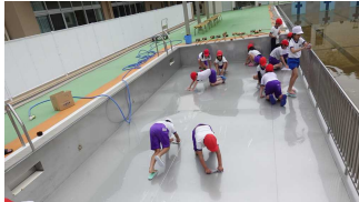
自分から ピカピカに！