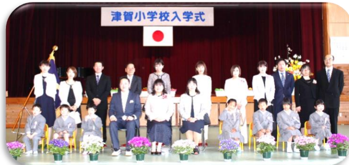
津賀小学校入学式

子どもたちが誇りをもち、保護者・地域の皆様から信頼される学校づくりに向け、教職員一同、尽力してまいります。地域の皆様、保護者の皆様、本年度もご支援ご協力のほどよろしくお願いいたします。