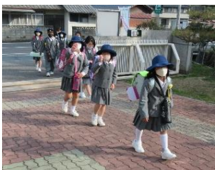
元気な1年生 17名が通学し始まりました。