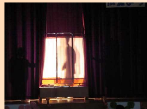
シルエットクイズ