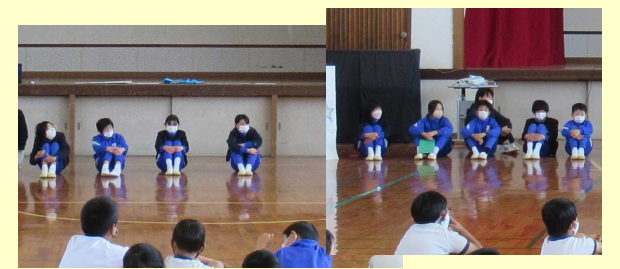
写真は、5月2日(火)に行った『1年生を迎える会』の各学級の様子です。