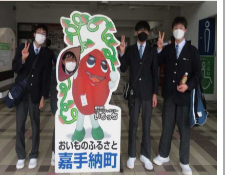
おもひふるさと 嘉手納町