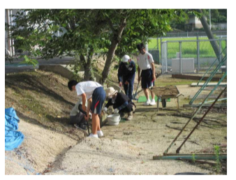
【グラウンドの溝掃除】 お世話になりました。