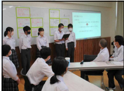
【グループワーク】テーマを決めて意見交換、発表しました。