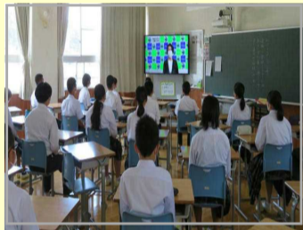
リモートで集会を行いました。夏休み中の活躍の表彰もありました。