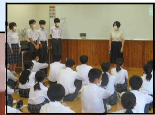
執行部が活動について説明をしました。