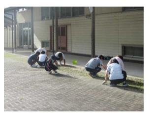
【中庭の草取り、苔取り】