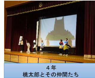
4年 桃太郎とその仲間たち

6年生が学年閉鎖中でしたが、学習発表会を実施しました。どの学年も、日頃の学習の成果を発揮して、よい発表をすることができました。練習もよく頑張りました。