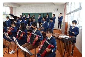
3年生から6年生による合奏 「世界にひとつだけの花」