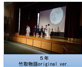
5年 竹取物語original ver.