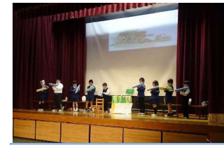
2年 お手紙～えんじょうバージョン～