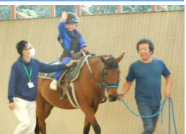
ワクワク ドキドキ

1・2年生 乗馬体験 楽しんでいた乗馬体験でした。馬にえさをやったり、乗ったりしました。かわいかったけど、ドキドキもしました。とてもいい体験ができました。