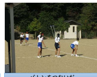
バトンをつないだ