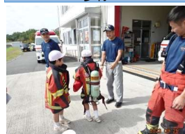
消防服を着ました

3年生 消防署の見学 吉備中央出張所に見学に行きました。消防車や救急車の説明を聞き、すごい仕組みに驚きました。日頃から訓練をして、いざというときに出勤して下さることに頼もしく思いました。