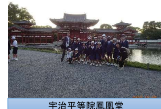
宇治平等院鳳凰堂

1泊2日の修学旅行でした。とてもたくさんの見学場所で、子どもたちは、目を輝かせていました。家族や親せきを思い、お土産を見ている子どもたちをいとおしく思いました。大きく成長できた旅行でした。素晴らしい修学旅行団でした。保護者の皆さまのご支援に感謝します。