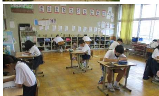
第1回全校漢字大会 5年生

6月26日に第1回全校漢字大会をしました。13時25分から、それぞれのクラスで取り組みました。放送で話をした後、各クラスを回ると、どのクラスも、一生懸命取り組んでいました。