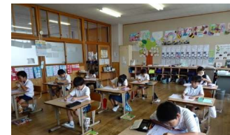
第2回全校漢字大会 2年生

7月10日、第2回を実施しました。放送で、「1回目より良い点数を取ろうと頑張った人!立派です。」と話しました。1学期の漢字大会の合言葉は、「ねばる」です。わからないかもしれないけど、時間いっぱい考え、ねばってみる。あと一息頑張ってみる力は、大切な力です。