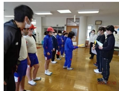
感謝の気持ちを伝えよう

「昔の給食」 24日(火)の給食は、「昔の給食」でした。鮭の塩焼き、即席漬け、すいとん汁、そして、ジャンボおにぎりでした。いつも、工夫を凝らした給食をおいしくいただいています。